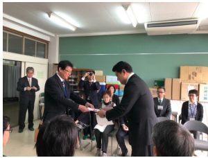
学校長より目録贈呈を 戴く磯崎県青年部会長