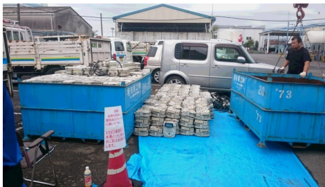
ミライフ(株)相模原オフィス